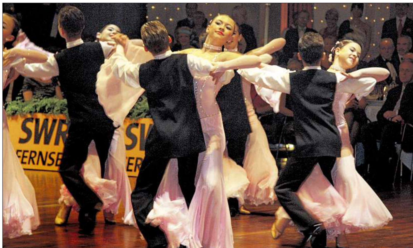
VIEL APPLAUS FÜR DIE JÜNGSTEN DES ABENDS: Die Petersburger Formation, alles Sieger der All Russian Competition Standard und Latein, besteht aus Kindern zwischen zehn und 13 Jahren. Sie zeigten ein Medley aus Standardtänzen.

Mit dabei waren das Weltmeisterpaar Franco Formica und Oxana Lebedew, die inzwischen Kurstädter geworden sind und im Schnitt eine Woche pro Monat in der Bäderstadt verbringen. „Uns gibt die Natur Kraft, die Stadt ist fantastisch“, schwärmt Oxana Lebedew von ihrer Wahlheimat. Was diese neue Kraft bewirken kann, zeigten die Latein Weltmeister unter anderem in den Tänzen Jive, Rumba, Passodoble und Samba. Mit hautengen aufregenden Kostümen umschlangen sich die beiden, kokettierten mit dem Publikum und vor allem Franco Formica, der eine unglaubliche schauspielerische