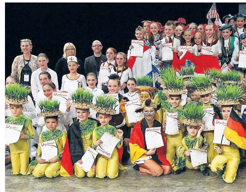
Die Formation der Penguin Kids (vorne) freute sich über ihren fünften Platz im Finale mit ihrer Darbietung „König der Löwen“.