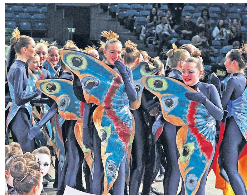
Tränen der Freude flossen bei den Junioren der Penguin Tappers nach dem Gewinn des Weltmeistertitels bei den Formationen.

Die 1. Formation trat mit ihrer Kür „Renaissance“ an, klassisch